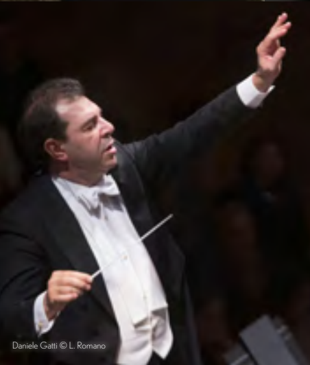
Daniele Gatti