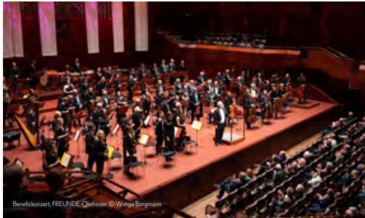
Benefizkonzert, FREUNDE-Orchester

Tickets für Nicht-Mitglieder ab 1. November