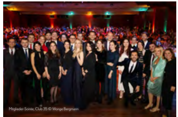
Mitglieder-Soirée, Club 35