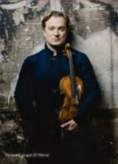
Renaud Capuçon

Die FREUNDE stellen die Guides, die mit großem Engagement ehrenamtlich durch die Alte Oper führen. FÜHRUNGEN buchen Sie bitte über die Homepage der Alten Oper: www.alteoper.de