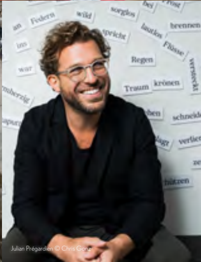
Julian Prégardien