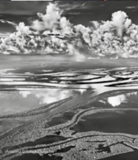
Amazonia © Sebastião Salgado