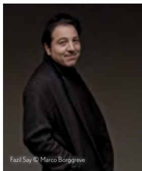
Fazil Say

Künstlergespräch in der Pause mit Fazil Say