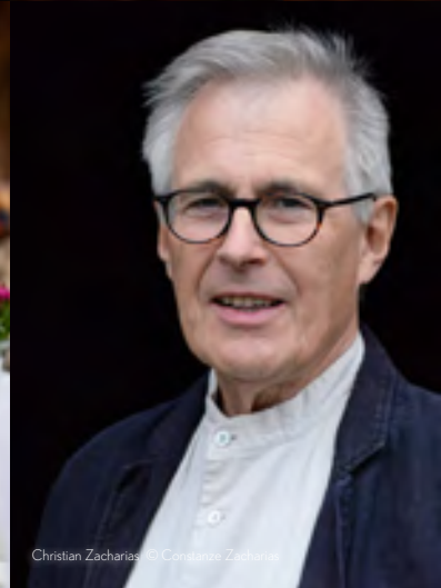
Christian Zacharias