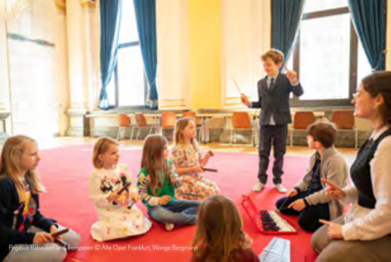
Pegasus Rabauken und Trompeten